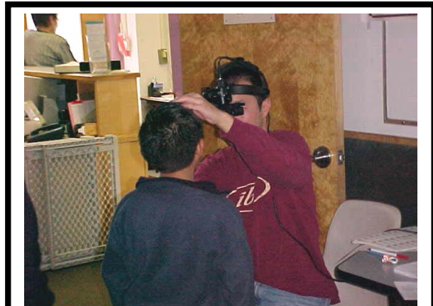
La subención de lentes de aumento a los estudiantes de LMCHD hizo posible un programa de exploración a través del cual se condujeron exámenes visuales.

La donación fue rectificada en el año 2003, para incluir a los alumnos pre-escolares con necesidad de lentes de aumento, y la Junta Directiva aprobó fondos para que 25